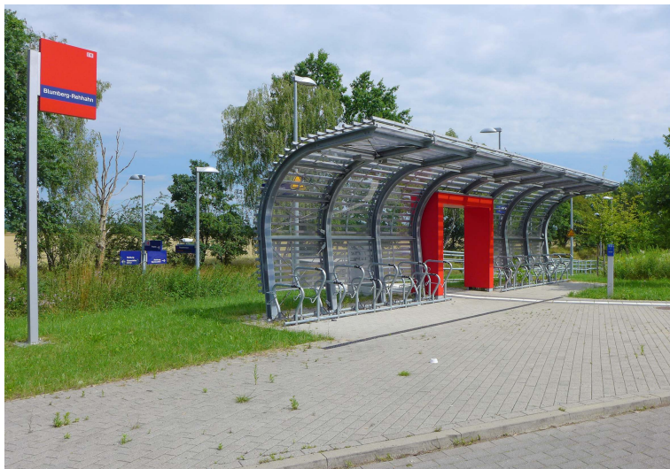
Der Zugang zum neuen Haltepunkt Blumberg-Rehhahn schafft eine Sichtverbindung zwischen Straße und Bahnsteig und bietet gleichzeitig Platz für Fahrräder